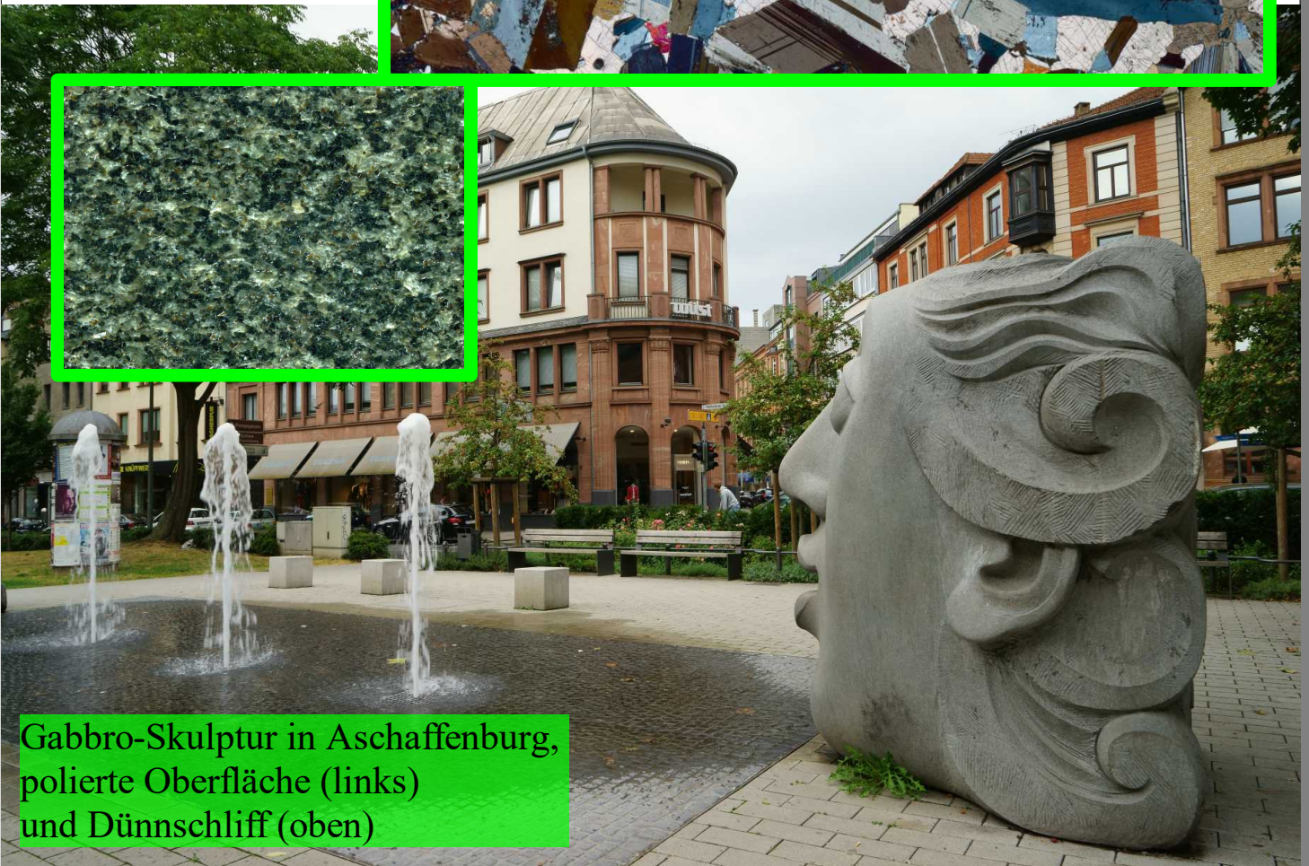
Gabbro-Skulptur in Aschaffenburg, polierte Oberfläche (links) und Dünnschliff (oben)

Der Gabbro ist ein Gestein, welches aus einer basaltischen Schmelze in der Erde auskristallisiert (Magmatit). Es besteht aus Feldspat, Amphibol und Eisenoxid. Ein großes und mit 2,061 Milliarden Jahren sehr altes Vorkommen gibt es Südafrika. Dort baut man riss- und porenfrei Blöcke ab, die in Aschaffenburg, z. B. von der Fa. Planolith, bearbeitet werden – mit großer Präzision bis zu 1 \mu\text{m}/\text{m} genau! Man fertigt daraus Mess- und Kontrollplatten.